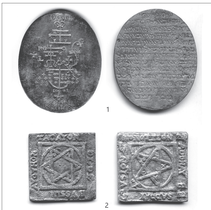
Рис. 5. 1 — амулеты с имитацией текста на арамейском языке. ФКОИХМ, КГОМ1–17643/5,6; 2 — амулеты с изображением пентаграммы и гексаграммы. ФКОИХМ, КГОМ1–17643/9,10

Предпринимались неоднократные попытки перевести этот текст. Во время написания этой статьи были получены консультации у двух специалистов: Александр Рыбалка (Израиль) — переводчик с иврита, исследователь мистических традиций и тайных об-