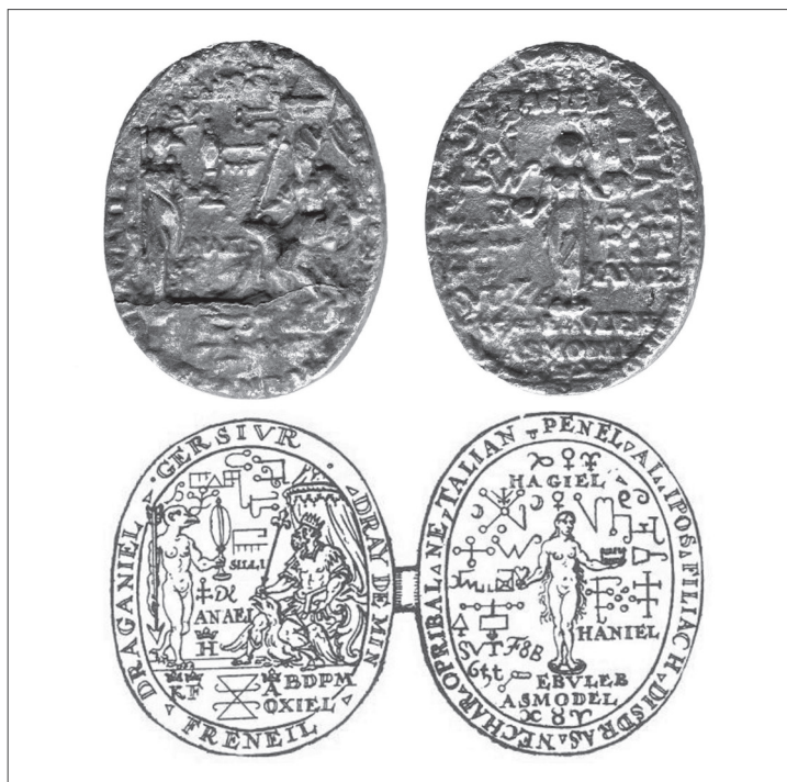
Рис. 4. «Амулет Екатерины Медичи». ФКОИХМ, КГОМ1-17643/7,8; прорисовка двух сторон

Имитациями этого талисмана сейчас успешно торгуют, в том числе и специализирующиеся на продаже «магических» предметов интернет-магазины. Вот один из примеров рекламы: «Этот талисман Венеры принадлежал Екатерине Медичи, он помогает отыскать настоящую любовь и счастье взаимности, а также гармонию и понимание в супружестве. Венера защищает прекрасный пол от тяжелых болезней, а также